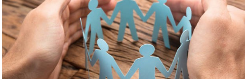
FICHE 4 : Notre engagement dans une démarche de bienveillance